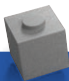
PLOT 62.5 0,625 x 0,625 x 0,625 m 570 KG