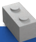
PLOT 125 1,25 x 0,625 x 0,625 m 1140 KG