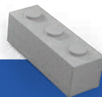
PLOT 187.5 1,875 x 0,625 x 0,625 m 1710 KG